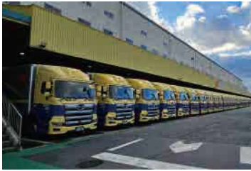
④鳥栖支店（佐賀県鳥栖市）