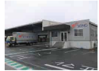
③筑豊支店（福岡県鞍手郡小竹町）