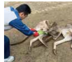
「九州西濃運輸 廃棄野菜」 検索結果はこちらから↓