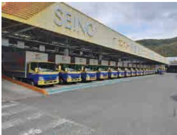
⑥長崎支店（長崎県諫早市）