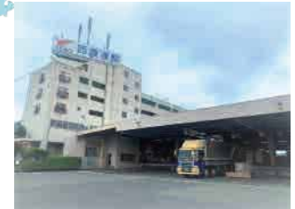
⑦熊本支店（熊本市東区）