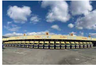
②福岡支店（福岡市博多区）