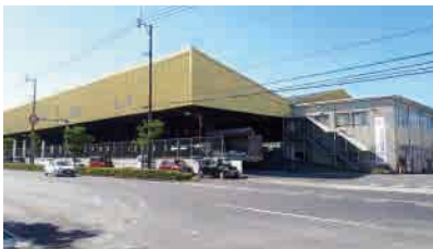
⑧鹿児島支店（鹿児島市）