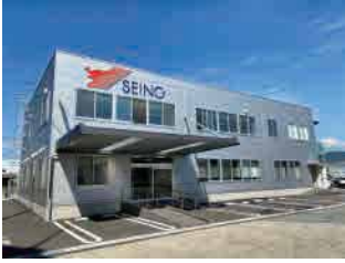
①本社（福岡市博多区）